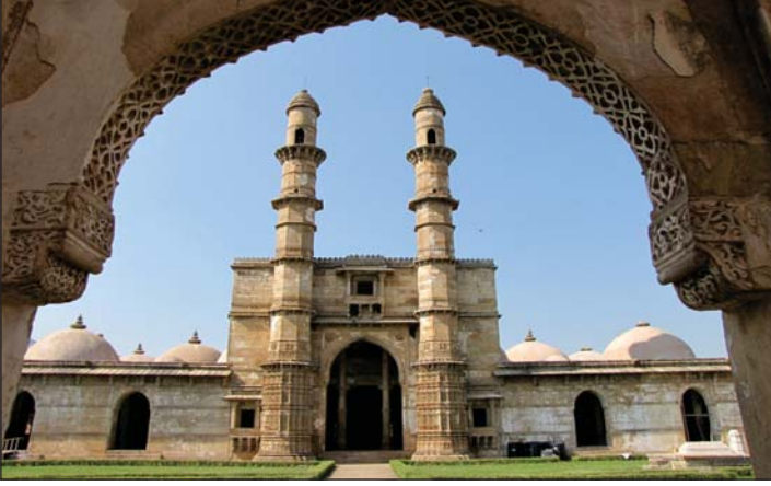
6.9 જામી મસ્જિદ - ચાંપાનેર