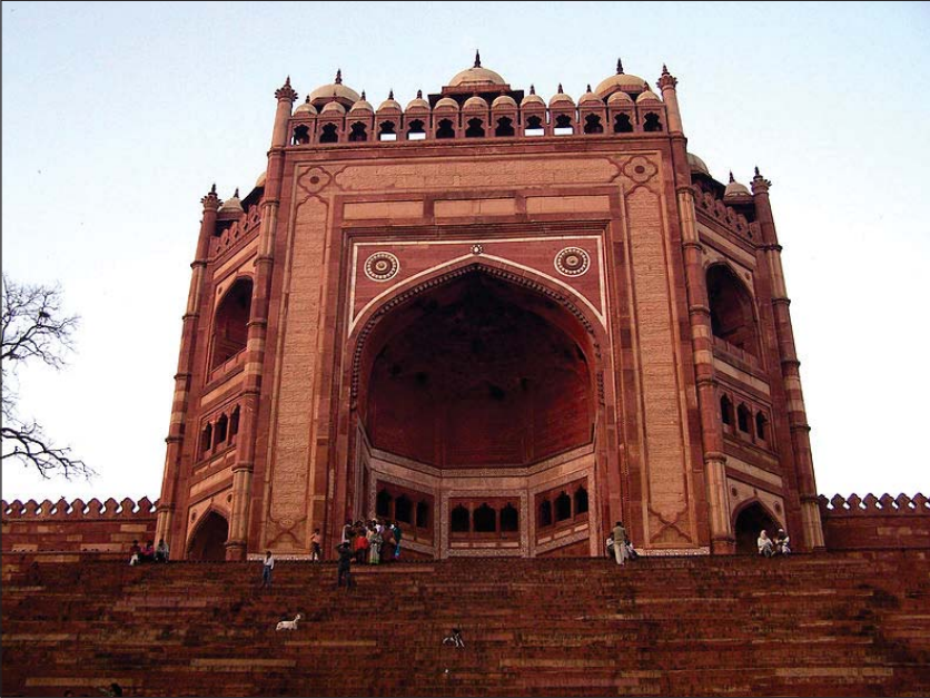
6.7 બુલંદ દરવાજો

ઉત્તર પ્રદેશના આગ્રાથી 26 માઈલ દૂર ફતેહપુર સિકરી આવેલું છે. અકબરે સૂફી સંત સલીમ ચિસ્તીની યાદમાં આ શહેર વસાવ્યું હતું અને તેને પોતાની રાજધાની બનાવી હતી. સીકરીમાં ઈમારતોનું બાંધકામ કાર્ય ઈ.સ. 1569માં શરૂ થયું અને ઈ.સ. 1572 સુધીમાં અહીં ઘણી ઈમારતો બંધાઈ. આ ઈમારતોમાં બીરબલનો મહેલ, બીબી મરિયમનો સુનહલા મહેલ, તુર્કી સુલતાનનો મહેલ, જામે મસ્જિદ અને તેનો બુલંદ દરવાજો શ્રેષ્ઠ છે.