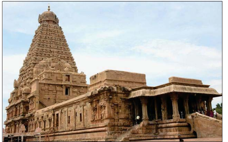
6.3 બૃહદેશ્વર મંદિર

આ મંદિર ચોલ વંશના રાજા રાજરાજ પ્રથમે બંધાવ્યું હોવાથી તેને રાજ રાજેશ્વર મંદિર પણ કહે છે. આ મંદિર 500 ફૂટ લંબાઈ અને 250 ફૂટ પહોળાઈ ધરાવતા કોટવાળા ચોગાનમાં બનાવેલું છે. આ મંદિરનું શિખર જમીનથી લગભગ 200 ફૂટ ઊંચું