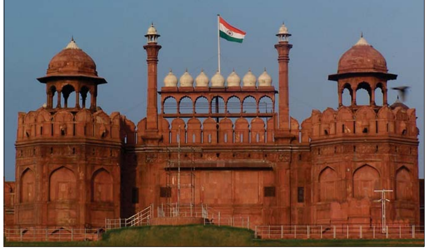
6.6 લાલ કિલ્લો

દિલ્હી સ્થિત લાલ કિલ્લાનું નિર્માણ શાહજહાંએ ઈ.સ. 1638માં કરાવ્યું હતું. લાલ પથ્થરોમાંથી તૈયાર થયેલ આ કિલ્લામાં શાહજહાંએ પોતાના નામથી શાહજહાંનાબાદ વસાવ્યું હતું. આ કિલ્લાની અંદર દીવાન-એ-આમ, દીવાન-એ-ખાસ, રંગમહેલ જેવી મનોહર ઈમારતો બંધાવી હતી. દીવાન-એ-ખાસ અન્ય ઈમારતોની તુલનામાં વધુ અલંકૃત છે. તેની સજાવટમાં સોનું, ચાંદી, કિમતી પથ્થરોનો અદ્ભુત સમન્વય થયો છે.