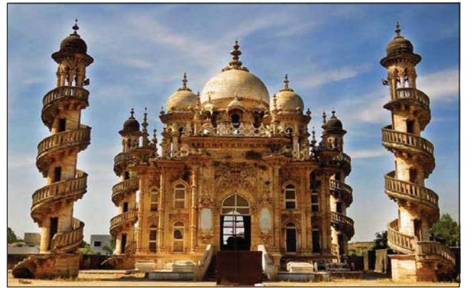
6.10 બહાઉદ્દીન વજીરનો મકબરો

જૂનાગઢમાં અશોકનો શિલાલેખ, ખાપરા કોડિયાની બૌદ્ધ ગુફાઓ ઉપરકોટ, જૈન મંદિરો, દામોદર કુંડ, અડીકડીની વાવ, જૂનો રાજમહેલ, નવઘણ કૂવો, મહાબતખાનનો મકબરો, બહાઉદ્દીન વજીરનો મકબરો વગેરે જોવાલાયક સ્થળો છે. મહાશિવરાત્રિએ ગિરનાર તળેટીમાં ભવનાથનો મોટો મેળો ભરાય છે.