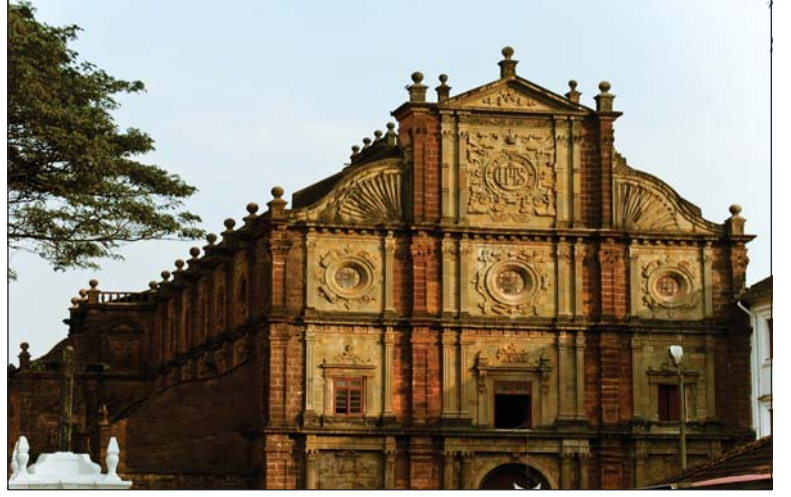
6.8 બેસાલીકા ઓફ બોમ જીસસ દેવળ-ગોવા

પોર્ટુગીઝો સાથે ખ્રિસ્તી ધર્મના ધર્મગુરુઓ પણ ભારતમાં આવ્યા. ગોવા પોર્ટુગીઝોની રાજધાની હતી. અહીં બેસાલીકા ઓફ બોમ જીસસ કે બેસાલીકા ઓફ ગુડ જીસસ દેવળ જૂના ગોવામાં આવેલું છે. અહીં સેન્ટ ફાન્સીસ ઝેવિયર્સનો પાર્થિવ દેહ સાચવીને મુકાયો છે. ઘણાં વર્ષો પછી પણ તેમનું પાર્થિવ શરીર વિકૃત થયું નથી. આ ઉપરાંત ગોવામાં અનેક ચર્ચ (દેવળ) આવેલાં છે. તેમ જ ગોવા તેના રમણીય દરિયાકિનારા માટે પણ જાણીતું છે.