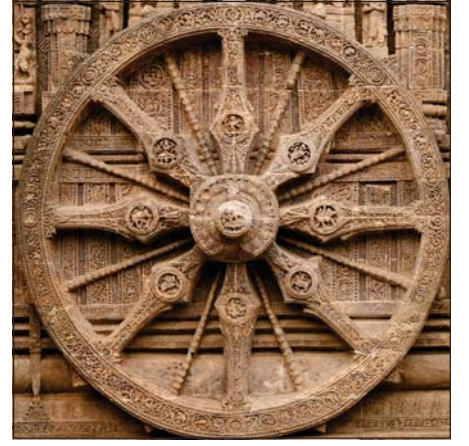
6.2 કોણાર્કના સૂર્ય મંદિરનું રથ ચક્ર

ઓડિશા રાજ્યના પુરી જિલ્લામાં બંગાળના અખાત પાસે કોણાર્કનું સૂર્ય મંદિર આવેલું છે. આ મંદિરનું નિર્માણ 13મી સદીમાં ગંગવંશના રાજા નરસિંહવર્મન પ્રથમના સમયમાં થયું. આ રથ મંદિર સાત અશ્વો વડે ખેંચાતા સૂર્યના રથનું સ્વરૂપ પામ્યું છે. એને 12 વિશાળ પૈડાં છે. મંદિરના આધારને સુંદરતા પ્રદાન કરતાં આ પૈડાં વર્ષના બાર મહિનાને પ્રતિબિંબિત કરે છે. જ્યારે પ્રત્યેક ચક્રમાં આઠ આરા છે જે દિવસના આઠ પ્રહરને દર્શાવે છે. રૂપાંકનોની વિગત અને વિષય વૈવિધ્યની બાબતમાં આ મંદિર અદ્વિતીય છે. આ મંદિરનું